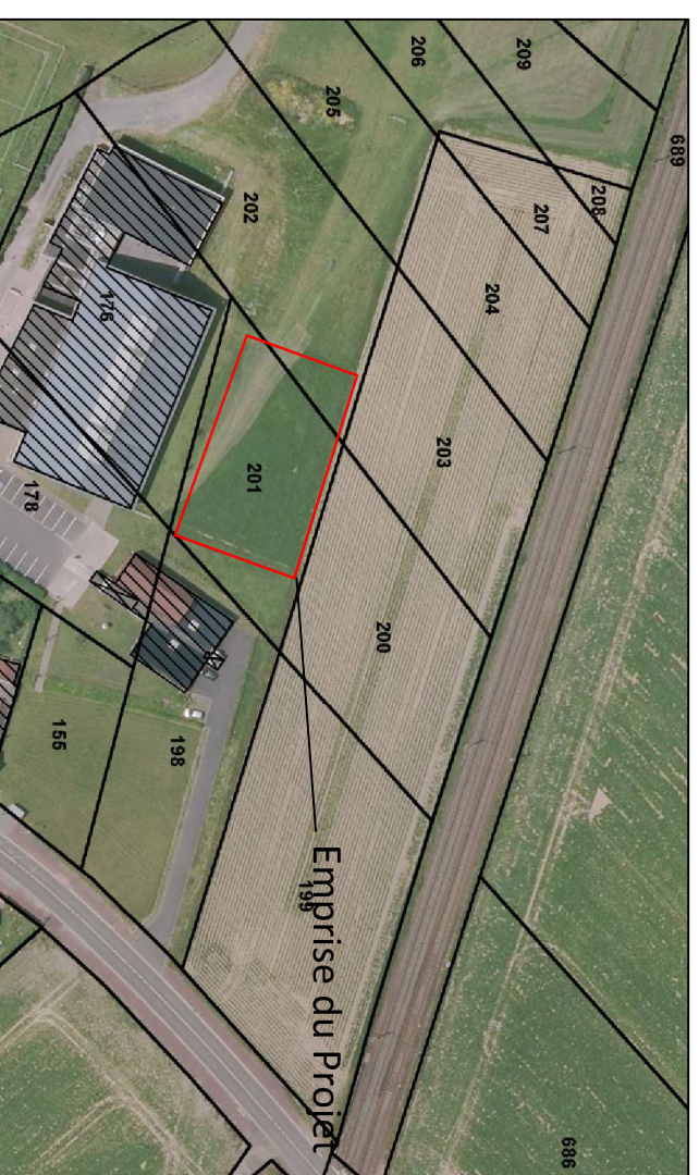
Emprise du Projet